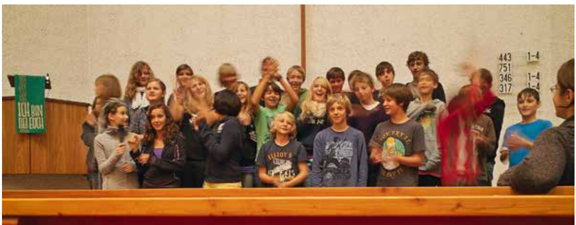
10 Jahre ist es her: die Konfirmanden 2011

Wir treffen uns für gewöhnlich einmal im Monat an einem Wochenende, hinzu kommen Ausflüge, eine Übernachtung in der Kirche und eine Wochenendfreizeit. Jedes Jahr nehmen auch ungetaufte Jugendliche teil, die sich dann während des Kurses taufen lassen. Der Konfirmationsunterricht beginnt am Sonntag, den 26. September 2021, mit der Begrüßung der Konfirmandinnen und Konfirmanden im Gottesdienst um 11 Uhr in der Markuskirche. Im Anschluss daran gibt's alle Informationen zum Kurs und die Möglichkeit der Anmeldung. Für die Sinzinger Jugendlichen beginnt der Konfirmationskurs am 18.09.